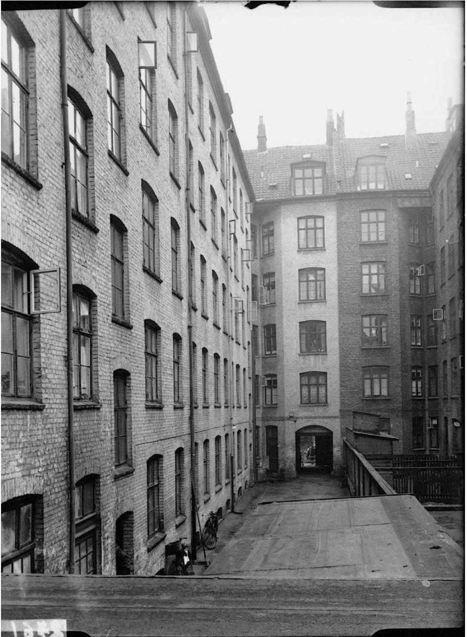
Tværhuset set langs den smalle gård ud mod porten til Fredensgade. 2 trapper førte op til tværhusets i alt 51 små lejligheder. Foto omkring 1950, hvor retiradebygningen er fjernet, og der er fælles wc på gangen på hver etage i forhus og tværhus. På den anden side af plankeværket er søsterejendommen nr. 16.