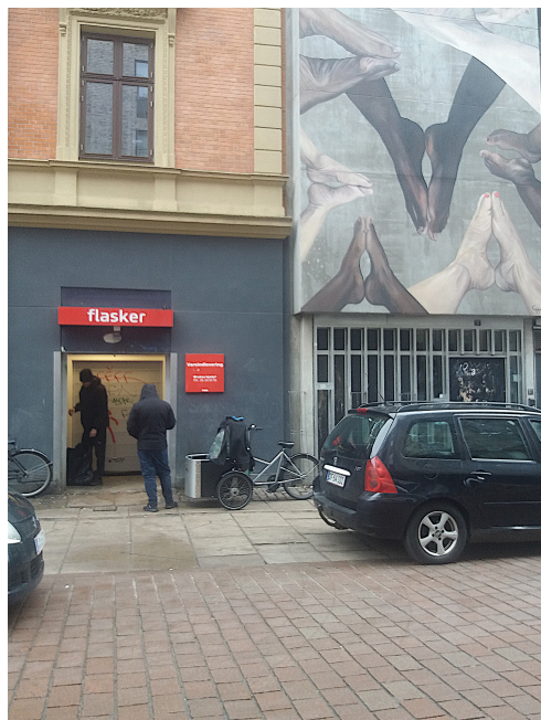
Pantautomaten, Griffenfeldsgade 1.

På Nørrebro som i det øvrige København har vi igen mødt tiggere efter at Danmark i 2001 sluttede sig til Schengenlandene. Tiggere omkring banegårde, på Strøget og foran visse supermarkeder som Netto og Brugsen men ikke foran Irma. Gestik og kropsholdning følger tusind år gamle traditioner. Det gælder om at være så tæt på gulvet som muligt. De fleste er voksne kvinder fra østeuropæiske visumfri Schengenlande. Det er ikke sikkert, at sælgere af Strada og Hus Forbi kan henregnes under tiggere, fordi de kan defineres som sælgere. I de første år efter at Rumænien, Ungarn og Bulgarien slap for visumpligten kom der mange hundrede enlige og familier til hovedstaden, ikke