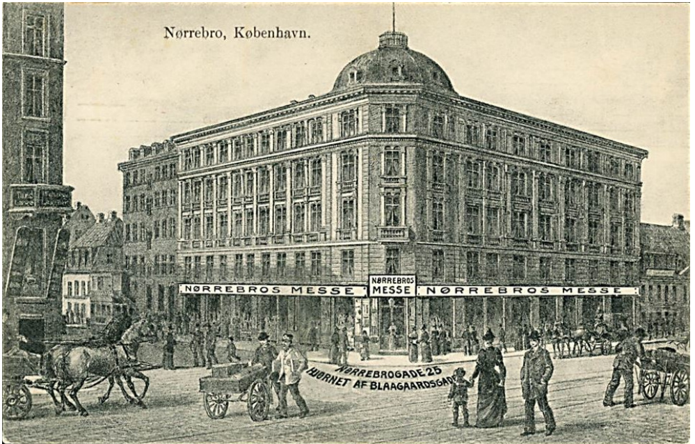
Nørrebros Messe. Nørrebrogade 25 ved hjørnet af Blågårdsgade. Tegnet postkort, ca. 1910.