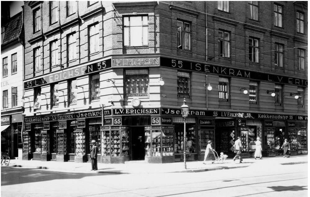
L.V. Erichsen Isenkram. Nørrebrogade 55 ved hjørnet af Griffenfeldsgade, 1935.