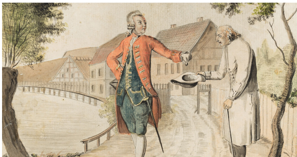
En rigmand giver en almisse til en tigger.

Med indførelsen af den lutherske reformation forsvandt tiggermunkene fra København. Luther selv skrev henvendt ”til den kristne adel af tysk nation” i 1520: ”For det én og tyvende. Det er vel én af de største nødvendigheder, at alt tiggeri bliver af-