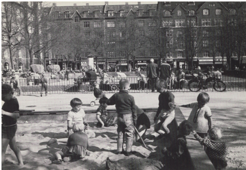
Legende børn på Blågårdens Plads, 1950'erne.