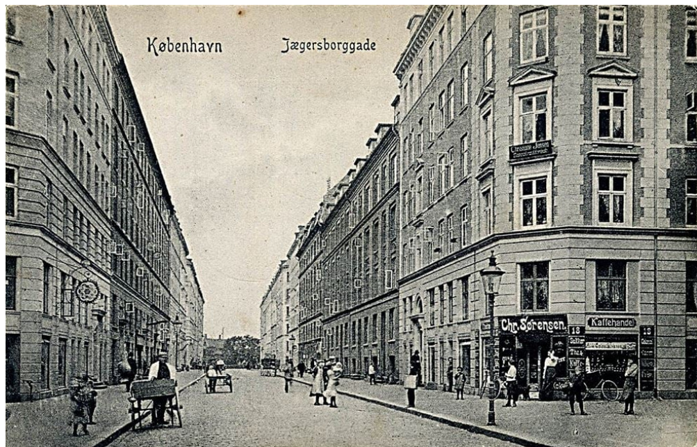
Jægersborggade, ca. 1910.