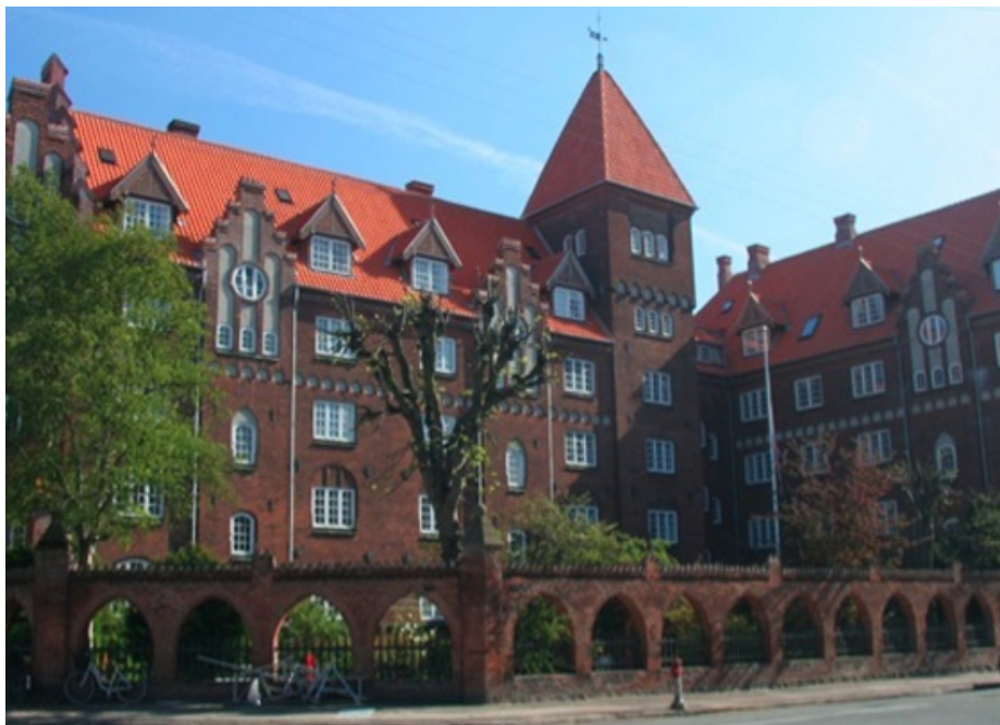
Klosteret på hjørnet af Bragesgade og Nannasgade.